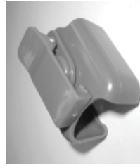
Sujetador para cinturón

Baterías recargables especiales de ion de litio Baterías del comunicador colgante - 2 unidades