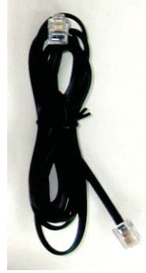
Cable de teléfono