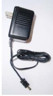
Adaptador de CA